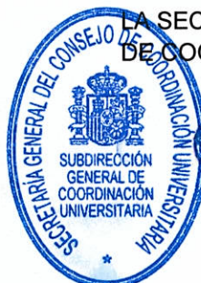
Carmen Fenoll Comes

LA SECRETARIA GENERAL DEL CONSEJO DE COORDINACIÓN UNIVERSITARIA